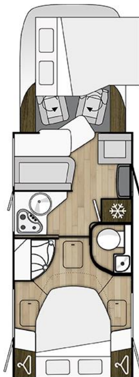
Tessoro 495 UP